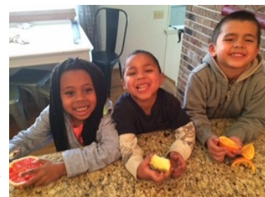
Fotografía de Christine Lentz